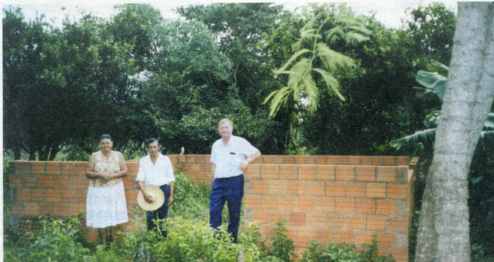
Kirkebyggeri på en af de mange udposter