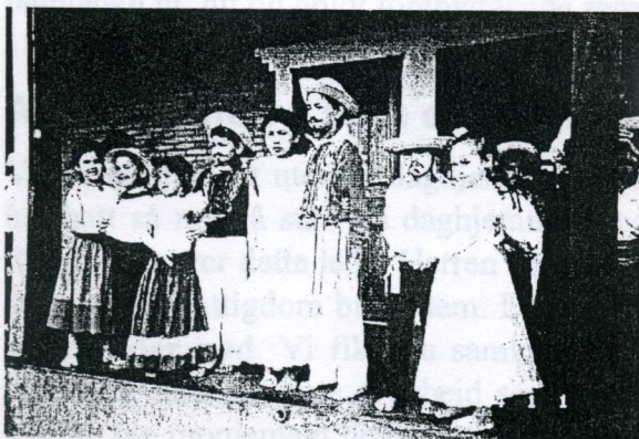
Figur 4 Avslutningen forskolen

har både lært å skrive og lese. Dette har ført til at vi har fått mange problembarn som ikke klarer å avansere i den nasjonale skolen. Men med Guds hjelp viser det seg at de ikke har så mye problemer etter at de får hjelp av oss. Vi hadde en fin avslutning på skoleåret med folkedans som de hadde trent på i lang tid. Og alle hadde laget fine drakter som de opptrådte i. Vi ser det som veldig viktig at de får med seg noe av sin egen kultur. Etter det var det utdeling av vitnesbyrd og en liten fest helt til slutt.