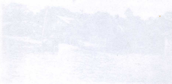
Figur 7 Oversvømmelse Saramiriza

...ald og kriminalitet, som er et stort problem, særlig i de store byene. Likevel må en kunne si at situasjonen er mer stabil enn tidligere år, og presidenten nyter fortsatt stor oppslutning på utvalgte områder.